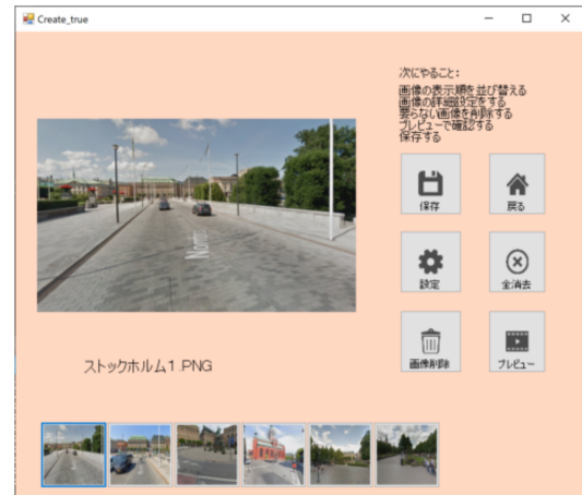
図 4: VR コンテンツ編集画面の例

一般的な PC でファイルを削除する際、“ゴミ箱”にファイルをドラッグ&ドロップすることで削除が可能である。このように、ドラッグ&ドロップは PC 操作で基本的であり、ユーザビリティにおいて重要な役割を果たす。ゆえに、本ツールでは基本的な操作をドラッグ&ドロップで行えるよう設計する。なお、機能ボタンをクリックすることでもそのボタンが持つ機能を使用することができる。コンテンツに使用したい画像を、ファイルエクスプローラからドラッグ&ドロップすることで、編集画面に画像を追加できる。追加した画像は編集画面の下部に画像が重畳表示されたアイコンと