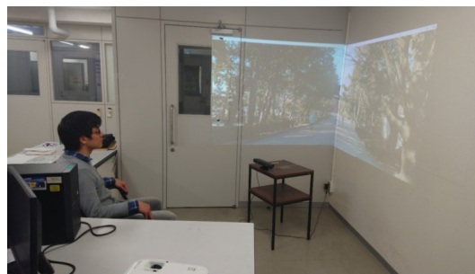
図 3: 心的ケア効果に関する実験の様子

本システムを利用した場合の主観評価による心的ケアの評価実験を行った。実験の様子を図 3 に示す。本来なら介護施設入居者や小児入院患者を対象に実験を行いたいとこ