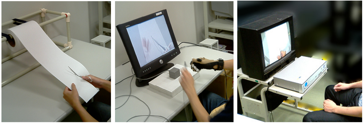
図1 実験課題：左) 現実ハサミ課題、中央) 両 VR ハサミ課題、右) VTR 監視課題

せることで、CG の紙を CG のハサミで切断する課題。現実の両手の動きは Polhemus 社 3SPACE FASTRAK によって検出され、それらのデータはコンピュータ処理によって手、ハサミ、紙の動きの CG として描画される。手の動きに合わせた環境変化の演算速度と描画速度は約 20fps であった。